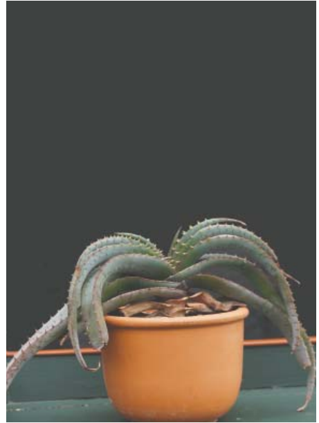
Aloe suprafoliata , (østl. RSA)