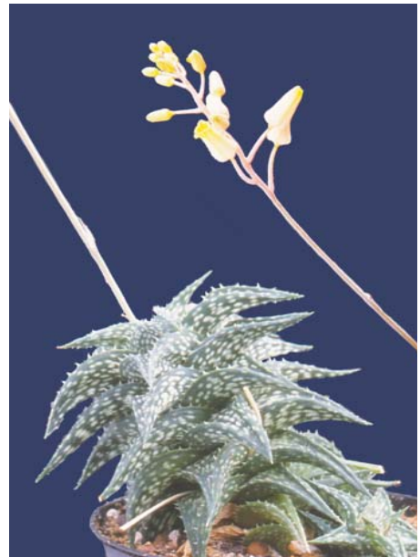
Aloe descoingsii , (Madagascar)