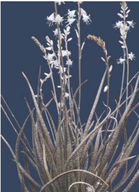
Aloe albiflora , (Madagascar)

Er almindelig i handelen. Trives også i vindueskarmen.