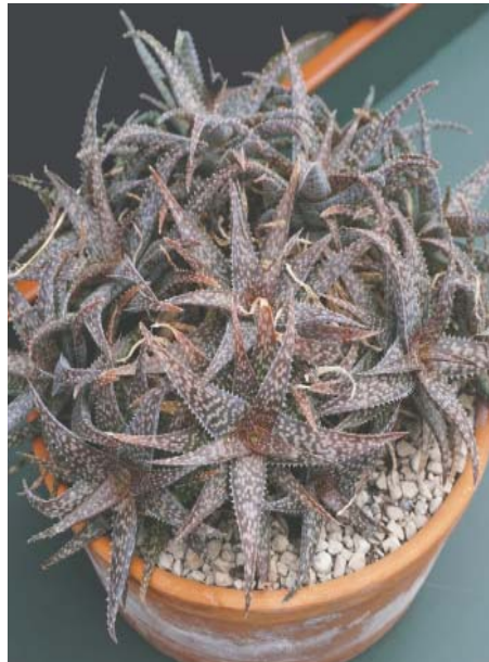
Aloe rauhii , (Madagascar)