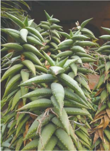
Aloe pearsonii , (RSA, Namibia)