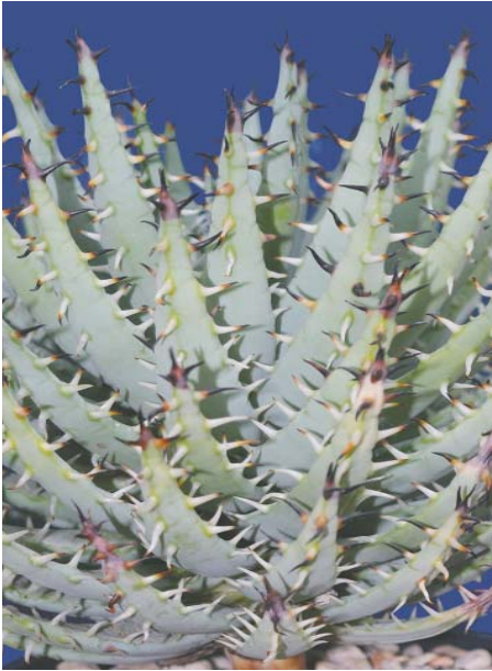
Aloe erinacea , (Namibia)