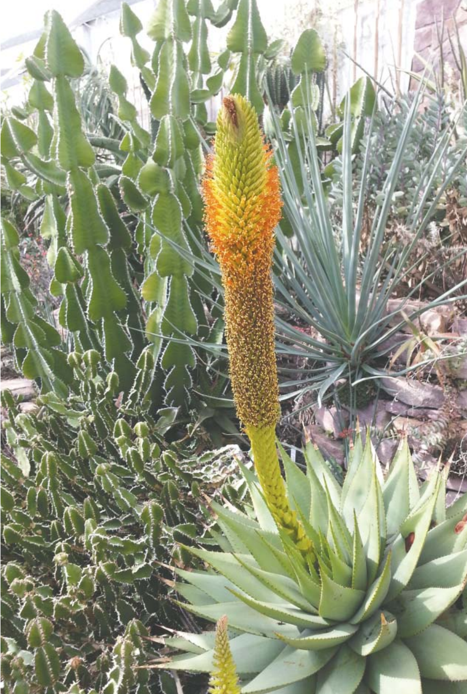
Blomstrende Aloe bromii , (RSA), Botanisk Have i Kbh.