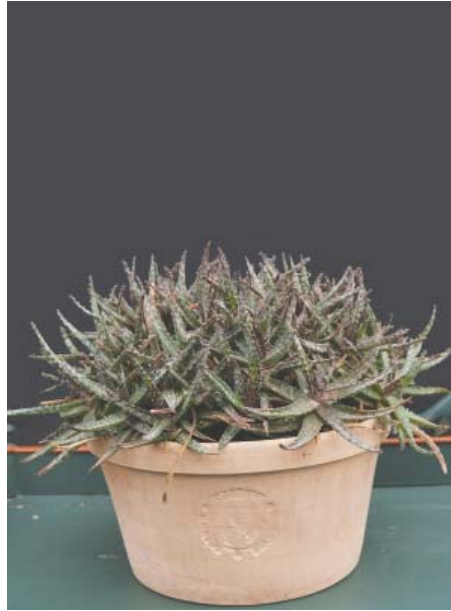
Aloe fragilis , (Madagascar) Nem dværg-aloe. Danner gruppe af mindre "hoveder"