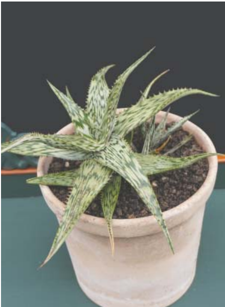
Aloe somaliensis , (Somaliland, Eritrea)