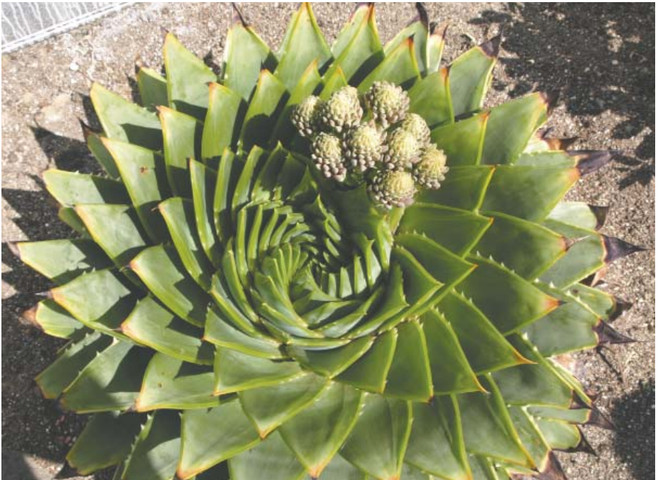
”Spiral-aloen” Aloe polyphylla , (Lesotho)

A. polyphylla vokser i bjergområder i Lesotho. Planten tåler let frost og er her udplantet frit foran et hollandsk gartneri. Planten er med blomsterknopper.