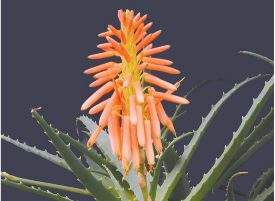
Aloe arborescens i blomst, (RSA og sydøstlige Afrika)

Er almindelig i handelen. Trives også i vindueskarmen.