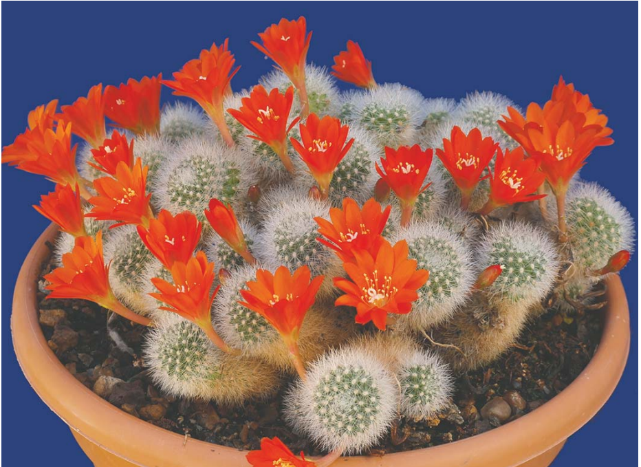
Rebutia fiebrigii ( Aylosteria fiebrigii )