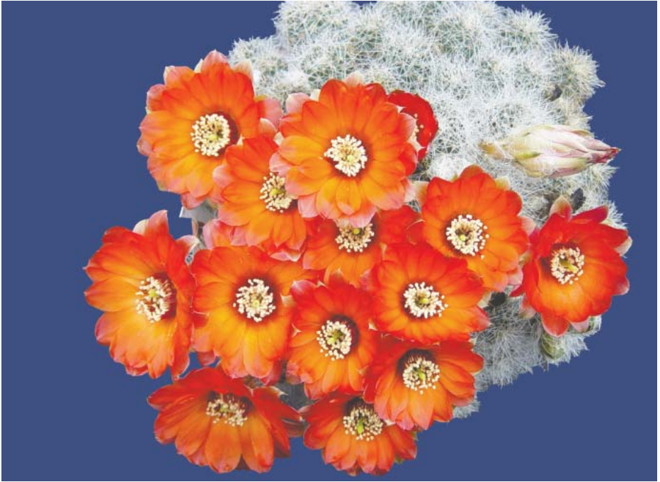
Rebutia einsteinii ssp. aureiflora ( Rebutia euanthema )