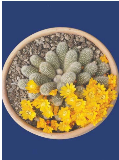
Rebutia fabrisii ( Aylosteria fabrisii var. aureiflora )