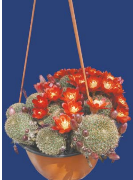
Rebutia deminuta ( Rebutia spegazziniana )