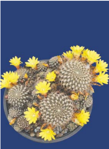
Rebutia breviflora ( Sulcorebutia caineana )